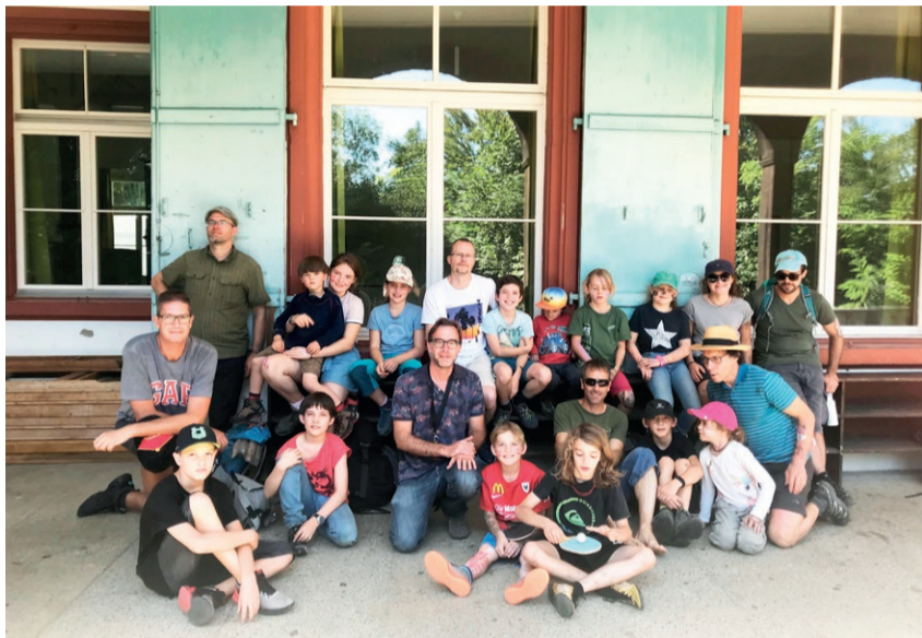
Gemeinsam Spass haben beim Vater-Kind-Wochenende