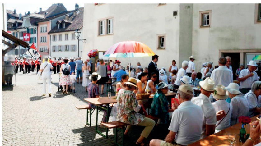
Endlich wieder ein Maienzugapero!