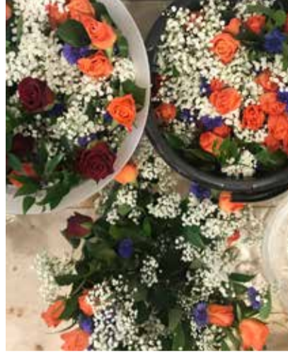
Freude schenken.

Bis 29. Juni bei Dagmar Bujack, dagmar.bujack@ref-aarau.ch, 062 836 60 75, oder Sonja Widmer, sonja.widmer@ref-aarau.ch, 062 836 60 84