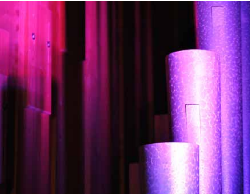
Klangwelten über Mittag.