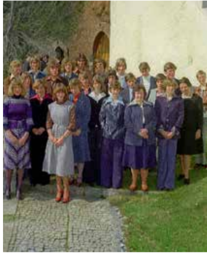
Dagmar Bujack Pfarrerin Symbolbild: Eine Konfirmation in den 1970er-Jahren.

Im Anschluss sind alle herzlich zum Apéro eingeladen.