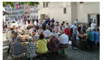
Anstossen auf dem Kirchplatz.