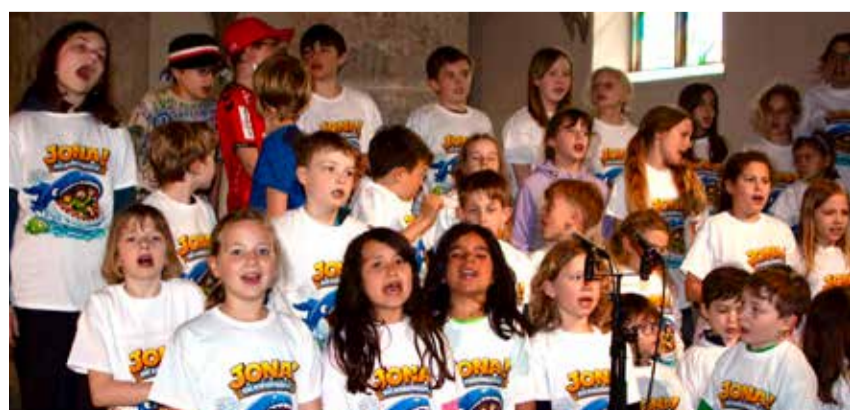
Die Kinder haben neben und auf der Bühne Spass.