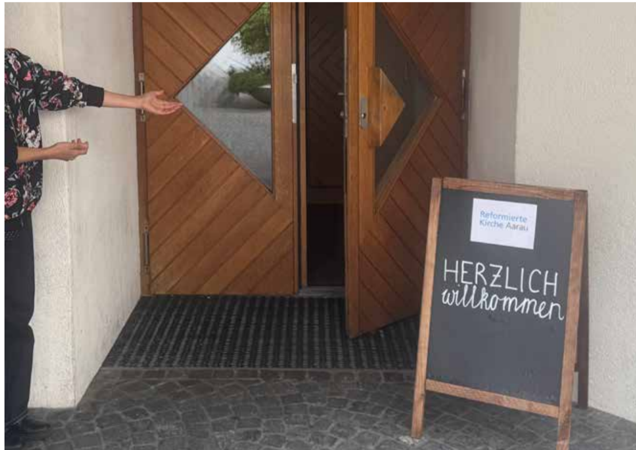
Eine offene Tür lädt zur Begegnung ein.

Diese Geschichte bringt auf berührende Weise zum Ausdruck, was Jesus im Matthäusevangelium sagt: «Ich war fremd, und ihr habt mich aufgenommen.» Ein einfacher Satz