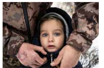
Auswirkungen des Krieges.