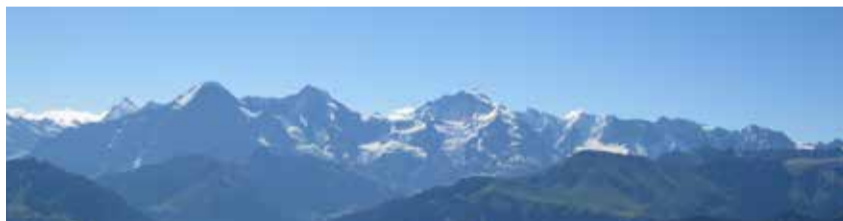
Alpenpanorama: kann auch ohne Feldstecher bestaunt werden.

Dagmar Bujack, Pfarrerin Sonja Widmer, Sozialdiakonin