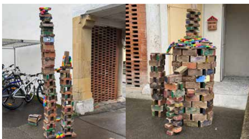
Gewinner der Kategorien «Turmhöhe» und «Kreativität».