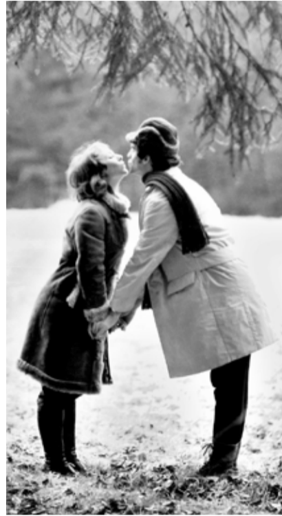
Liebende aus Ost und West.