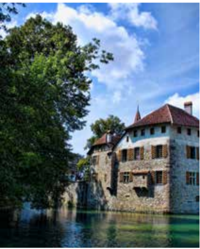
Schloss Hallwyl

Anreise mit Bahn und Bus via Lenzburg nach Seengen.