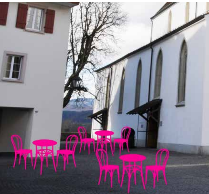
Ein Ort, an dem Menschen willkommen sind. Bild: Beat Peter; Montage: Marianne Weymann