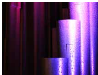
Klangwelten über Mittag.