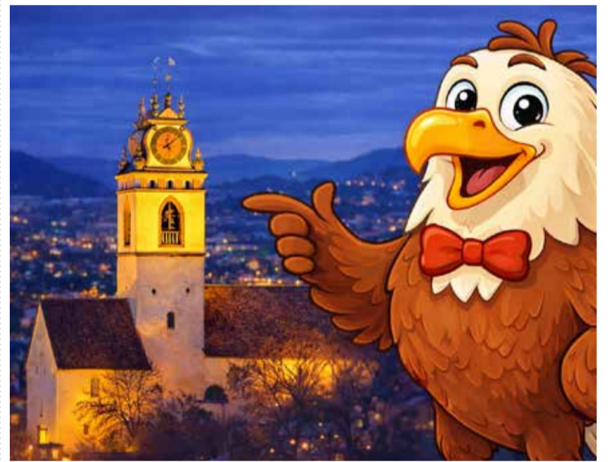
Mit dem Adler in die Stadtkirche.