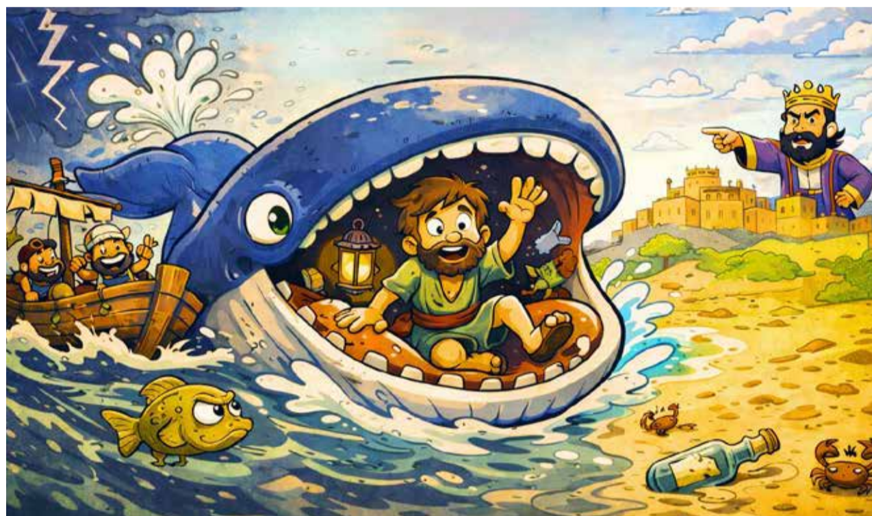
Jona ist gerettet: Aus der Flucht wird ein Neuanfang.

Und Jona? Der Prophet tut einmal mehr nichts. Er verkriecht sich im hintersten Winkel des Schiffes und schläft, bis ihn der Kapitän zur Rede stellt. Nach einigem Hin und Her wirft die Besatzung Jona