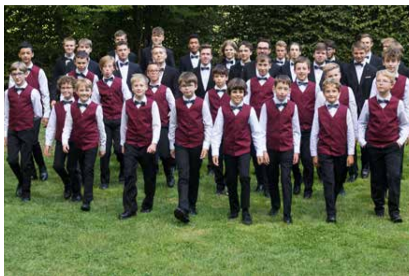
Capella Vocalis schreitet dem Konzertabend entgegen.

Der Knabenchor Capella Vocalis aus Reutlingen ist erneut in der Stadtkirche zu Gast. Das Programm zum Pfingstfest vereint geistliche Chormusik von Mendelssohn, Grieg, Brahms und anderen zu einem stimmungsvollen Abend voller Trost, Licht und Zuversicht.