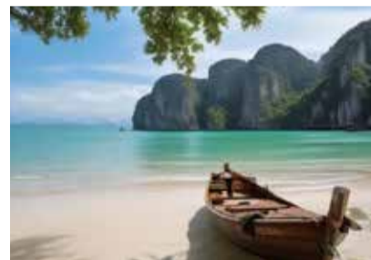
Das Abenteuer ruft.

Bleiben Sie informiert – mit unserem Newsletter