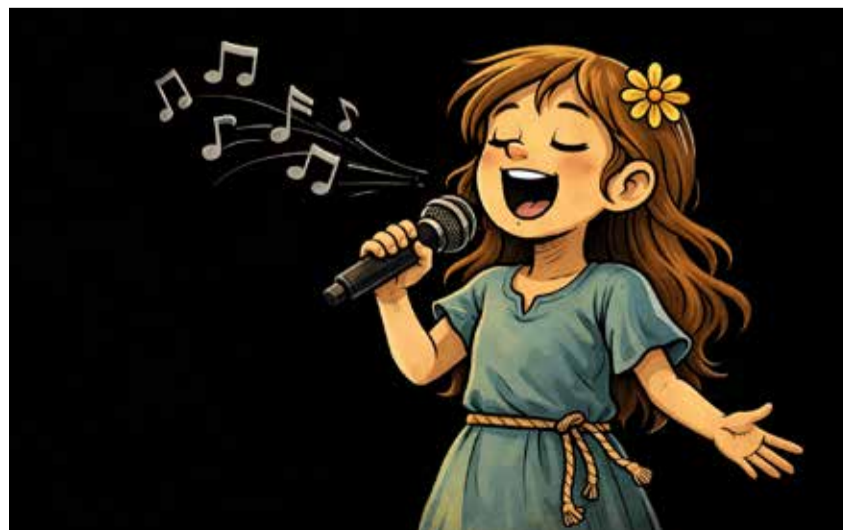
Kinder führen ein Musical auf.